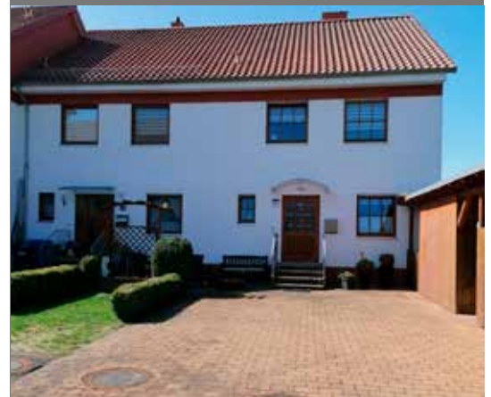
bis 1918 entstandene Gebäude im Sanierungsgebiet Gronau (Leine) Innenstadt