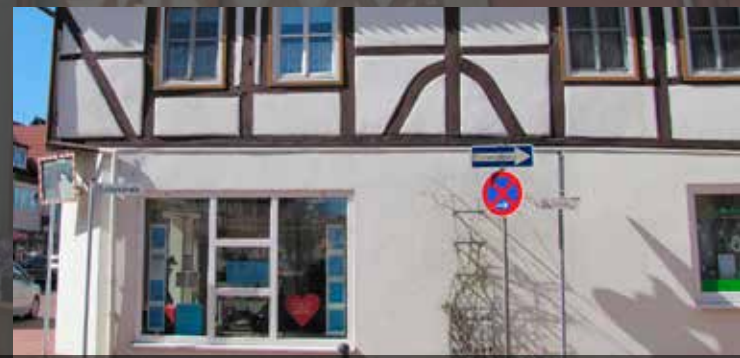
Dem Gebäudetyp entsprechende Schaufenster