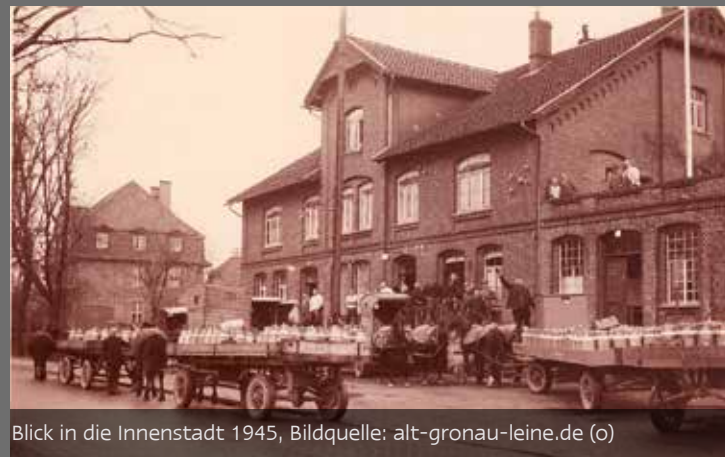
Blick in die Innenstadt 1945