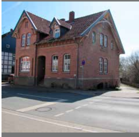
Backstein- / Klinkerfassaden im Sanierungsgebiet Gronau (Leine) Innenstadt