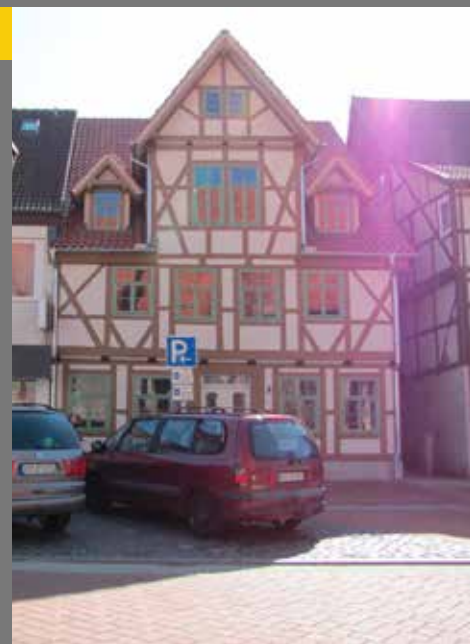
Sanierungsbeispiel (inkl. Schaufensterrückbau) Hauptstraße 8, Gronau Leine