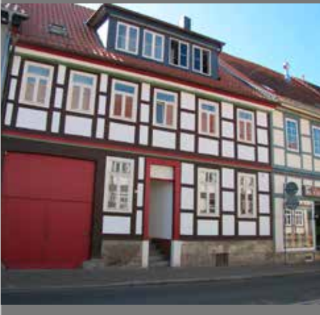
Fachwerkfassaden im Sanierungsgebiet Gronau (Leine) Innenstadt