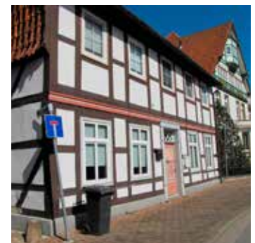
Fassadenarten und Fassadendetails in der Innenstadt