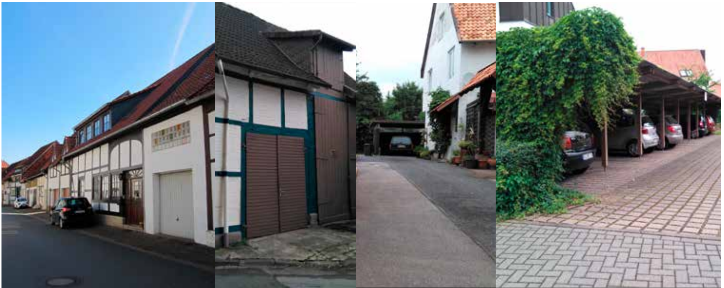
historische Nebenanlagen und neuzeitliche Stellplatzanlagen