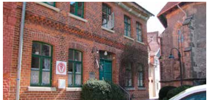
Beispiele für Fensterformate in der Innenstadt