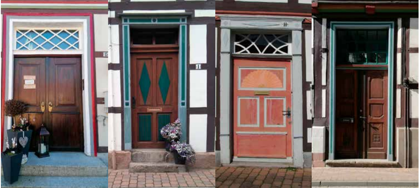
Beispiele für ortstypische Eingangstüren in Gronau