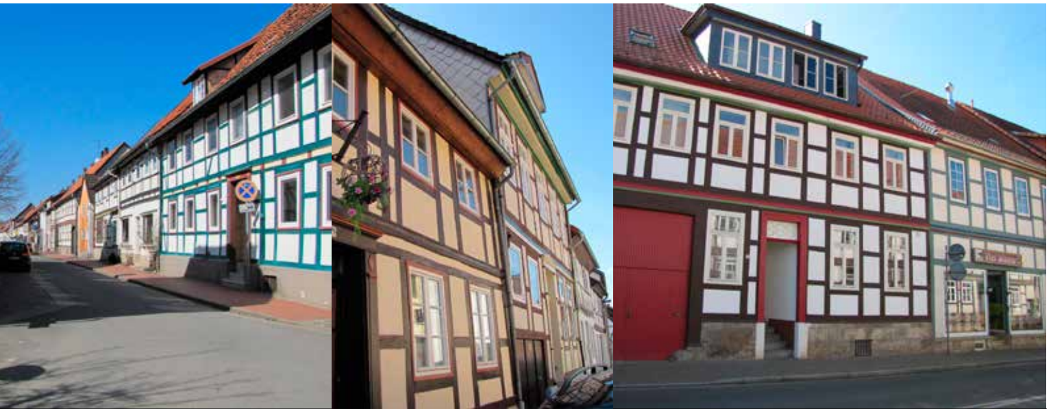
Beispiele für die Bebauungsstruktur der Innenstadt

Es unterliegen zudem 53 Gebäude dem Denkmalschutz.